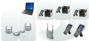
Rys. 2. Sprzęt służący do automatycznego gromadzenia danych.

Dzięki systemowi Jantar Trace oraz standardom GS1 udało się zrealizować cele biznesowe projektu.